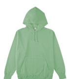
スモーキーグリーン