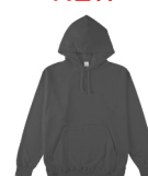
ダークチャコール