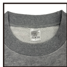
ブランドレスネーム

扱いやすいスタンダードな厚みと飽きの来ないシルエットでどんなスタイルにも自然に馴染みます。