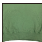
カンガルーポケット

老若男女問わず着用できるよう設計されたボディ、 サイズやカラーも豊富でどんな用途にもフィットします スタンダードなスタイルゆえ広く長く愛される1枚です